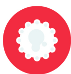
โรคซาร์ส (SARS)