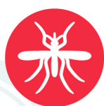
ไข้เหลือง (Yellow Fever)