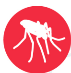
ไวรัสซิกา (Zika)