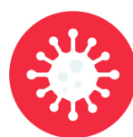
ไข้หวัดใหญ่ (Influenza)