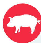
ไวรัสสัวด์แอฟริกาในสุกร (African Swine Fever)